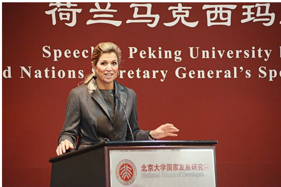
马克西玛·索雷吉耶塔发表演讲

显得尤为重要。马克西玛·索雷吉耶塔十分关注中国企业的发展，阿里巴巴、腾讯、中国移动等公司的名字不时出现在她的演讲中。她表示，中国正采取各种有效措施，提高金融服务的可获得性，在促进经济发展、减少贫困人口等方面取得了巨大的进步，但中国还有很多工作要做。为此，她鼓励年轻人积极参与普惠金融发展，为国家发展作出贡献，因为“未来属于你们年轻一代”。