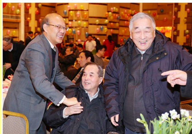
校领导向著名专家学者代表致以新年的问候