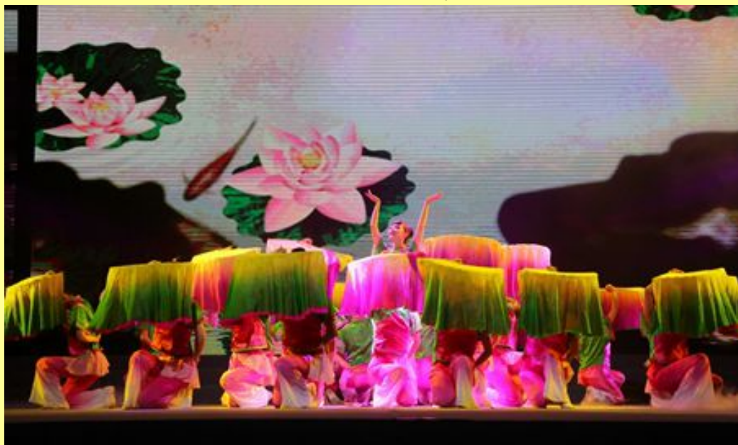
教工舞蹈团表演舞蹈 《清荷》

后勤合唱团登台演唱歌曲《我的中国心》，他们用最朴实的歌声表达了北大后勤工作者最真挚的爱国之心。教工舞蹈团表演的舞蹈《清荷》，古朴典雅、舞姿曼妙，令人沉醉；街舞风雷社的节目《二零一舞》则炫动斑斓，变幻多彩，充满现代气息。